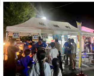
青年部のポップコーンは大人気。ビールも飛ぶように売れました。