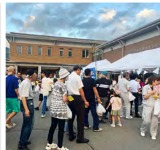
女性部はチーズたこ焼きを販売。ビールのおつまみにぴったり!

恒例の「テクノさかき工業団地組合まつり」に青年部、女性部が今年も出店し、祭りの盛り上げに協力しました。