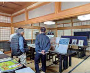
坂城の歴史探訪(坂木宿ふれあいガイド)

今年も事業所(お店)の皆さんの知識や技術を活かした多彩な講座を実施する坂城まちゼミが開催され、多くの参加者でにぎわいました。受講者からは「地域のお店を身近に感じられた」などの声が寄せられ、地域の魅力再発見につながる毎年恒例のイベントとなっています。