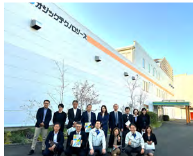
株式会社オジックテクノロジーズ様を見学させていただきました。

工業部会では、視察研修として熊本県を訪れました。現地企業や関連施設の視察を通じて、最新の技術動向や生産現場の取り組みについて理解を深めることができました。