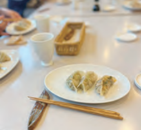
簡単餃子を作るう(cafe ぴろきち)